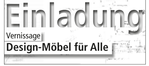
Vernissage auf der Bauen & Energie 2016