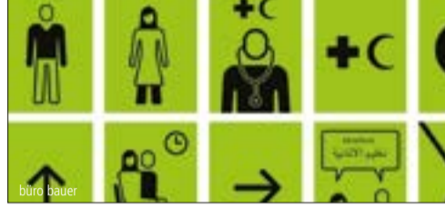
Informationsdesign für Inklusion