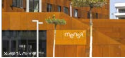
Vergabegesetz: Umsetzung von Design for All