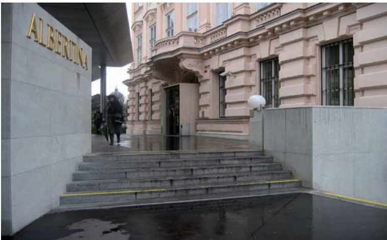
Abb. 3: Albertina – wo ist hier das (die) Geländer?

cess Consultant“ oder „Accessibility Consultant“ entwickelt, die Projekte hinsichtlich der barrierefreien Gestaltung während des Planungsprozesses bis zur Baufertigstellung begleiten. In Australien z.B. war nach der Einführung des Behindertengleichstellungsgesetzes einmal 4 Jahre keine Änderung der Planungspraxis ersichtlich. Dann kam es zu einem Verfahren, das bis zum Obersten Gerichtshof ging und danach sind die PlanerInnen aufgewacht und haben ihre Mitverantwortung erkannt. Inzwischen – 4 Jahre später – gibt es in Australien bereits mehr als 200 Access Consultants. In